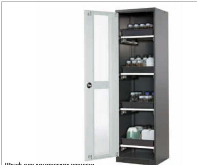
Шкаф для химических веществ CS-CLASSIC Модель CS.195.054(.WDFW) с распашными дверями (светло-серый RAL 7035) со стеклянным окошком, внутреннее оснащение с 4 выдвигаемыми полками включающими пластиковый поддон Заказ № 30563-041-30579

Также в наличии: Заказ № 30561-041-30573 (цвет светло-серый) Заказ № 30563-040-30573 (цвет желтый предупреждающий, со стеклянным окошком) Заказ № 30563-041-30573 (цвет светло-серый, со стеклянным окошком)