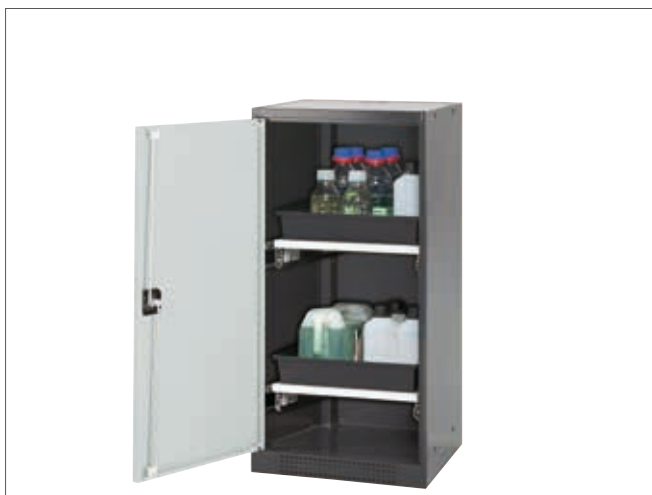
Шкаф для химических веществ CS-CLASSIC Модель CS.110.105(.WDFW) с распашными дверями (светло-серый RAL 7035), внутреннее оснащение с 2 выдвигаемыми полками, и нижним пластиковым поддоном Заказ № 30557-041-30571

Также в наличии: Заказ № 30557-041-30565 (цвет светло-серый) Заказ № 30559-040-30565 (цвет желтый предупреждающий, со стеклянным окошком) Заказ № 30559-041-30565 (цвет светло-серый, со стеклянным окошком)