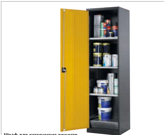
Шкаф для химических веществ CS-CLASSIC Модель CS.195.054(.WDFW) с распашными дверями (цвет желтый предупреждающий RAL 1004), внутреннее оснащение с 3 полками, перфорированная вставка и нижний приемный поддон (оцинкованный стальной лист) Orde 30561-040-30573

Также в наличии: Заказ № 30561-041-30573 (цвет светло-серый) Заказ № 30563-040-30573 (цвет желтый предупреждающий, со стеклянным окошком) Заказ № 30563-041-30573 (цвет светло-серый, со стеклянным окошком)