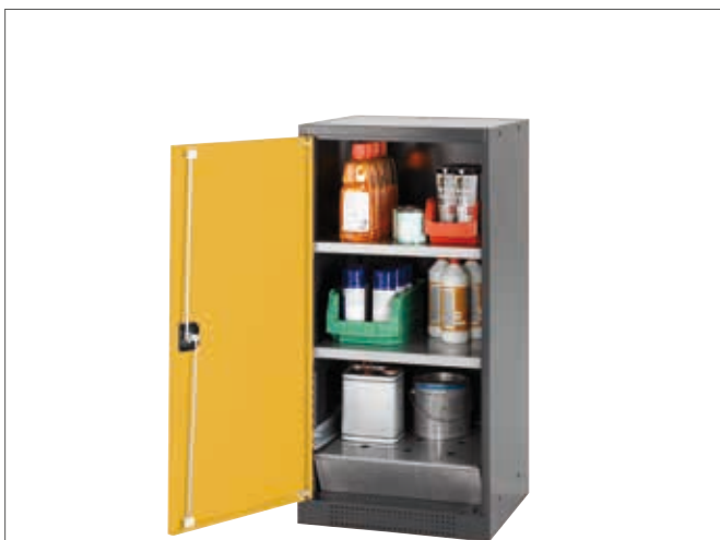
Шкаф для химических веществ CS-CLASSIC Модель CS.110.105(.WDFW) с распашными дверями (предупреждение желтый RAL 1004), внутреннее оснащение с 2 полками, перфорированная вставка и нижний приемный поддон (оцинкованный стальной лист) Заказ № 30557-040-30565

Также в наличии: Заказ № 30561-040-30579 (цвет желтый предупреждающий) Заказ № 30561-041-30579 (цвет светло-серый) Заказ № 30563-040-30579 (цвет желтый предупреждающий, со стеклянным окошком)